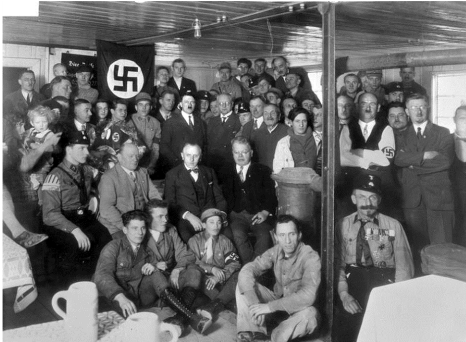
Адольф Гитлер и казначей нацистского Рейха Франц Ксавер Шварц на торжественном открытии реконструированного Дворца Барлова на Бриннерштрассе, «Коричневый дом», Мюнхен, 1930 год.